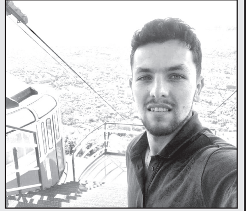
İnsaf Aydın Nijniy Novqorod Pedaqoji Dövlət Universiteti İdarəetmə və sosial-texniki servislər fakültəsi

otağı idi, orada hər zaman sakitliyə riayət edirdilər. Və bir də, orada oxuyan fərqli yaş təbəqələrində insanları görmək məni motivasiya edirdi.